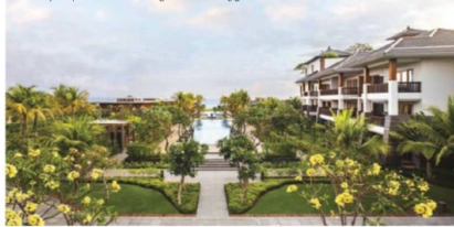
Lanskap tropis nan rimbun Regent Bali Canggu.