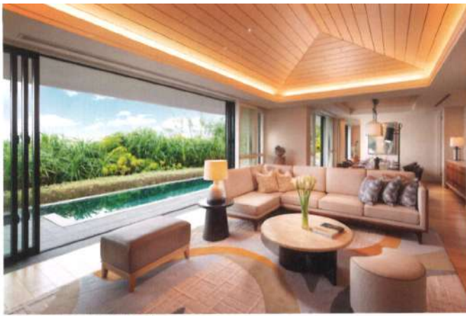
每棟別墅都設有私人泳池和露台。