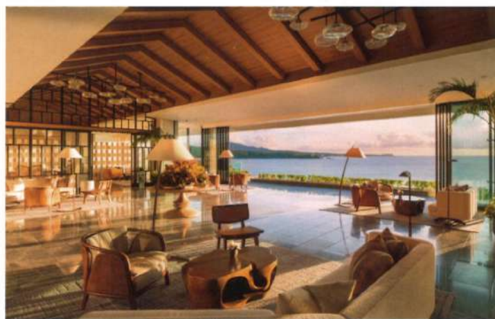
在酒店大堂可看到日落的景色。

此外，酒店還提供烹飪課程和傳統手工藝工作坊，讓旅客能夠親身體驗沖繩的傳統文化，學習當地的烹飪技巧和手工藝知識，讓旅客深入地瞭解沖繩的歷史與傳統。 除了康養和文化體驗，美食體驗也是 Halekulani Okinawa 的一大亮點。酒店擁有四間招牌餐廳，為旅客提供一場舌尖上的美食之旅。酒店的 SHIROUX 餐廳結合傳統與創新，為旅客呈現出精緻的日式佳餚；而 AOMI 餐廳則專注於展示當地風味，致敬沖繩的傳統美食。對於那些喜歡輕鬆氛圍的旅客，House Without a No. 則提供各式雞尾酒和美味小食，在享受美食同時，更可以欣賞壯麗的日落景色。