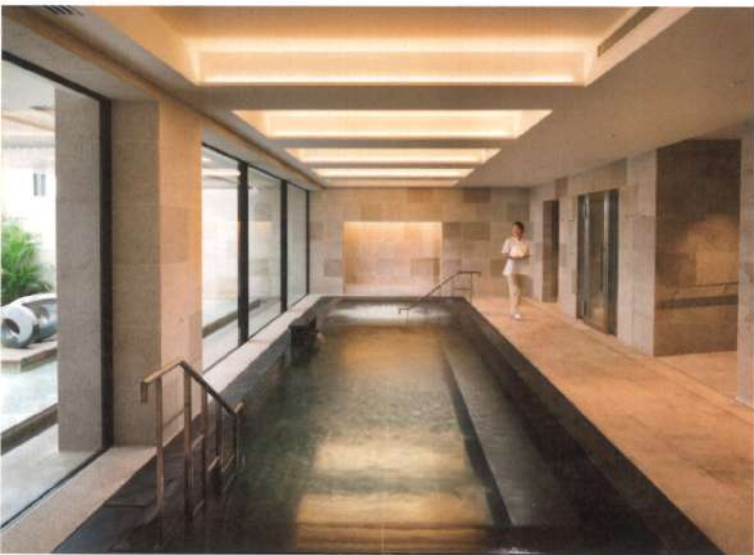
Spa-Halekulani 提供專業的健康理療服務，結合沖繩的自然元素與現代療法，為旅客提供個性化的放鬆體驗。

如果對沖繩的歷史和文化感興趣，距離酒店不遠的琉球文化村是一個理想的參觀地點。文化村展示了琉球王國時期的傳統建築和手工藝品，並定期舉辦傳統舞蹈和音樂表演。琉球村的设计旨在讓遊客深入了解沖繩的歷史與文化，這裡的每一個細節都忠實還原了沖繩的傳統生活方式。遊客可以在這裡了解當地的歷史、風俗和藝術，這對於那些渴望了解沖繩歷史的遊客來說是一個難得的機會。 [C]