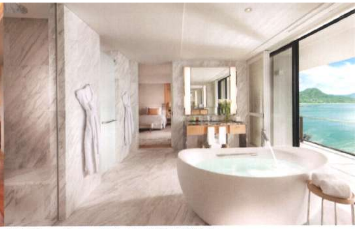
酒店以「Seven Shades of White」(七種白色)為設計主軸。

的花園，讓客人時刻感受到與大自然的親密聯繫。而每棟別墅都設有私人泳池和露台，為尋求私密空間的客人提供完美的度假體驗。