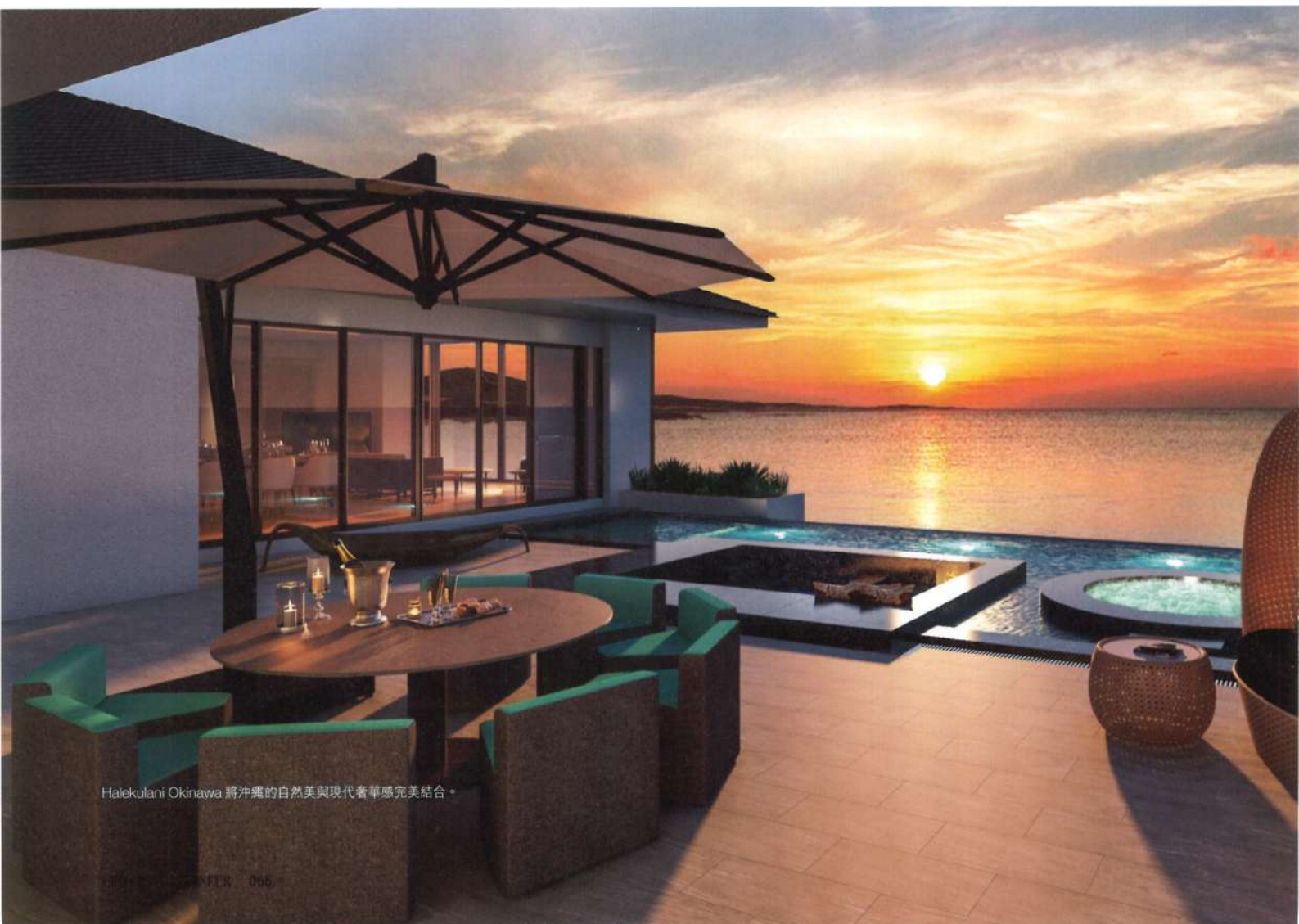
Halekulani Okinawa 將沖繩的自然美與現代奢華感完美結合。

其次，酒店提供了一系列的文化與自然探索活動：作為探索沖繩文化的橋樑，酒店與琉球大學合作推出了「Halekulani Okinawa Escapes」計劃。通過這一計劃，旅客可以參與當地的海洋保護活動，了解沖繩的海洋生態系統，或是參加量身定制的自然探索之旅，前往沖繩的自然保護區和文化遺址，加深了解這座島嶼的自然與文化遺產。