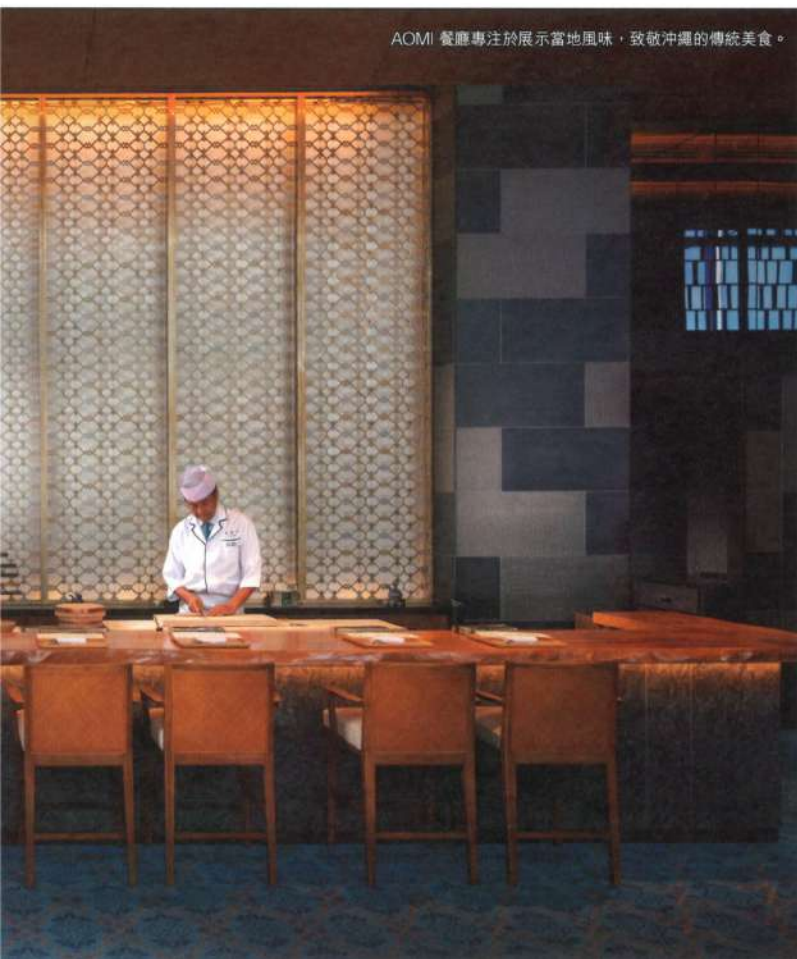
AOMI 餐廳專注於展示當地風味，致敬沖繩的傳統美食。