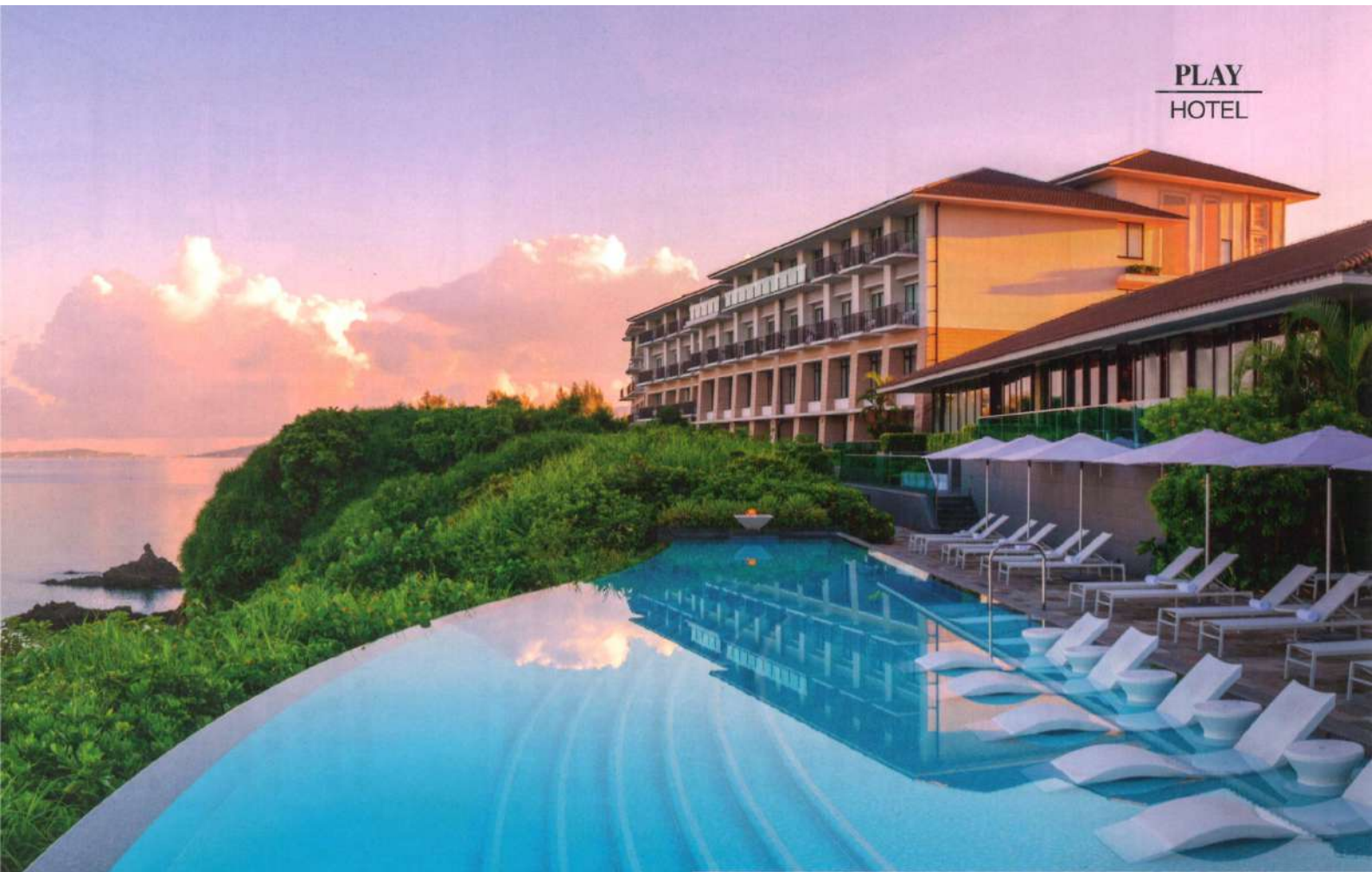
從建築到室內裝潢，每個細節都精雕細琢，無不流露出簡約而奢華的氣息。