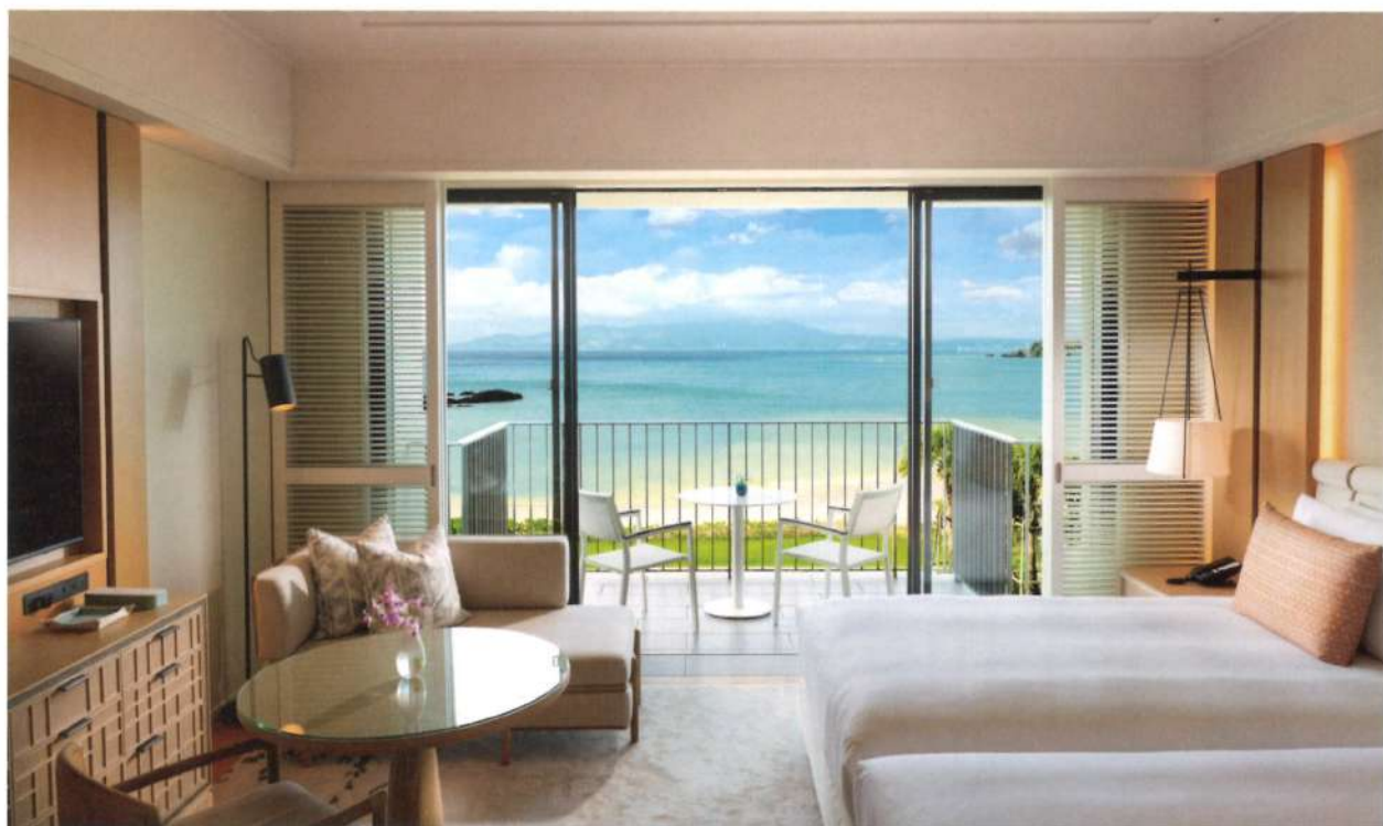
客房的設計靈感來自沖繩的自然景觀。

酒店擁有 360 間豪華客房，其中包括 45 間套房和 5 間獨棟別墅。客房的設計靈感來自沖繩的自然景觀，每間客房都能俯瞰美麗的海景或綠意盎然