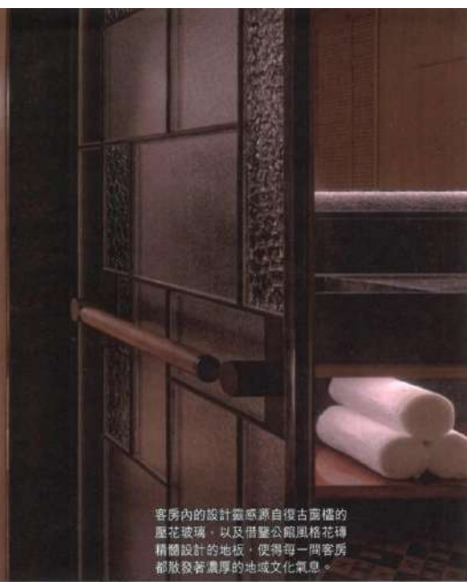
客房內的設計靈感源自復古窗櫺的壓花玻璃，以及借鑒公館風格花磚精雕設計的地板，使得每一間客房都散發著濃厚的地域文化氣息。

務，旨在幫助客人舒緩壓力，重拾身心平衡。水療中心的設計靈感來自自然與健康之力，五間設施齊全的護理房、傳統的土耳其浴，以及休閒空間等，為客人提供一個遠離都市紛擾的放鬆之所。阿麗拉水療的招牌護理融合了全天然成分與專業手法，讓客人在這裡享受深層的護理體驗。酒店還同時提供一系列高品質的日常健身設施和瑜伽室，滿足客人對健康生活的需求。