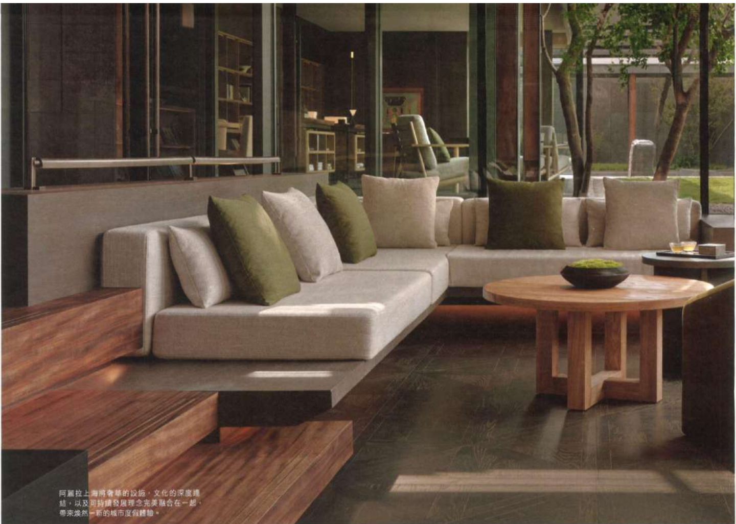
阿麗拉上海將奢華的設施、文化的深度連結，以及可持續發展理念完美融合在一起，帶來煥然一新的城市度假體驗。

客人從繁忙的都市生活中抽離，展開在阿麗拉上海的探索與平靜之旅。酒店會提供繡含檸檬百里香香氣的毛巾和一杯精心泡製的熱茶，讓客人瞬間感官得到喚醒，洗去旅途的疲憊。而在客人離店時，酒店則會贈送精心準備的檸檬百里香香囊，香囊由員工制服面料製作，希望客人可以留下紀念。