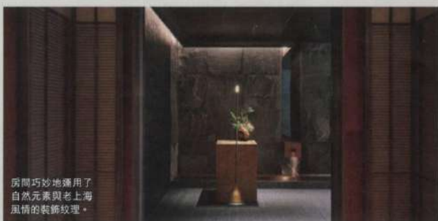
房間巧妙地運用了自然元素與老上海風情的裝飾紋理。