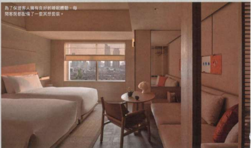
為了保證客人擁有良好的睡眠體驗，每間客房都配備了一套冥想套裝。

客人抵達時，酒店會為他們準備一場特有的歡迎儀式，這一儀式象徵著客人從繁忙的都市生活中抽離，展開在阿麗拉上海的探索與平靜之旅。