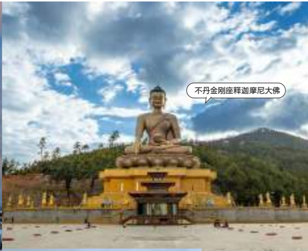
不丹金刚座释迦摩尼大佛