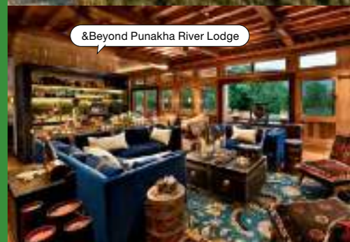
&Beyond Punakha River Lodge