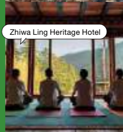
Zhiwa Ling Heritage Hotel