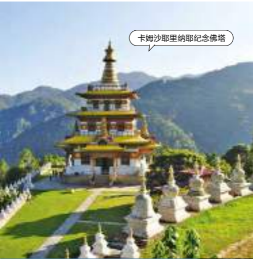
卡姆沙耶里纳耶纪念佛塔